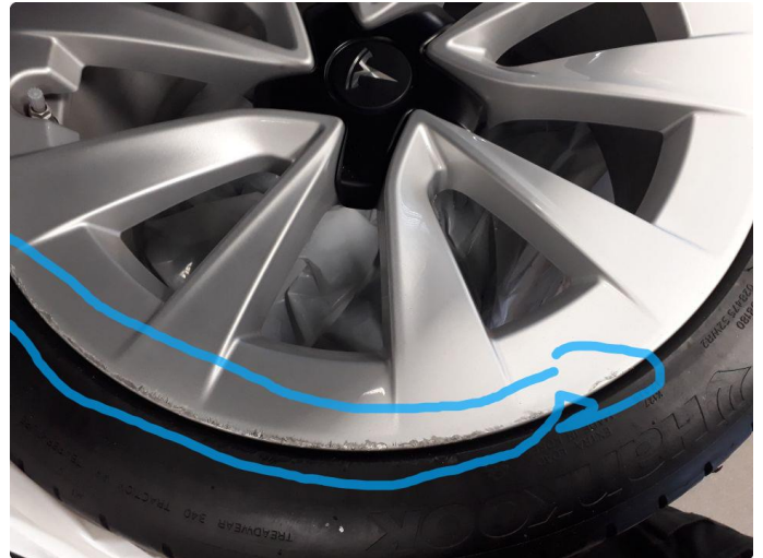
1.3 Kantkjørt felg