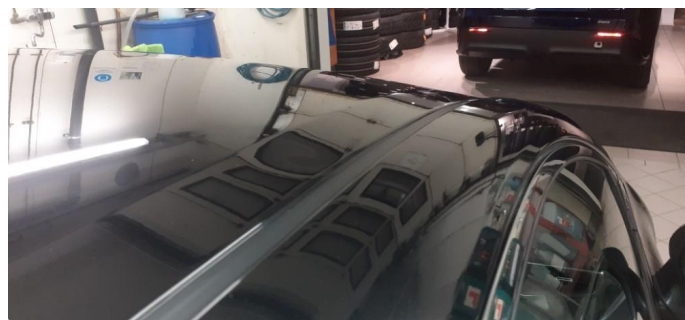
1.2 Noen små bulker på tak