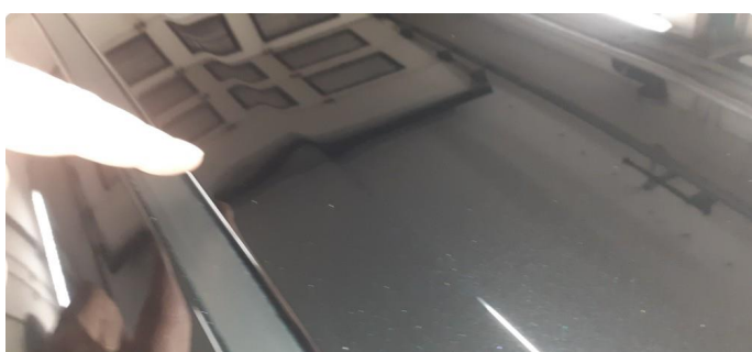
1.2 Noen små bulker på tak