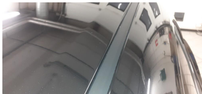
1.2 Noen små bulker på tak