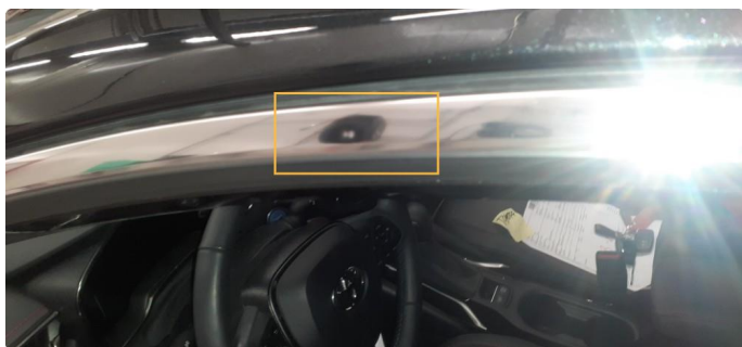
1.1 Liten "bulk" i chromelist, overkant førerdør