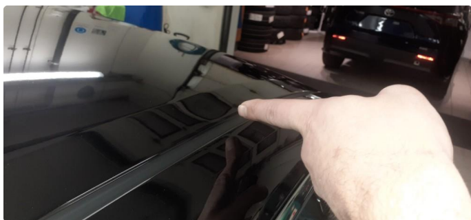
1.2 Noen små bulker på tak