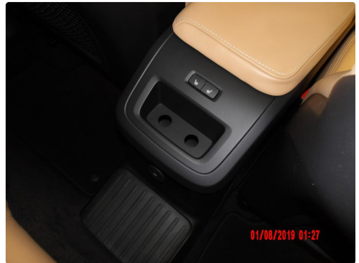
3.1 Øvrige feil