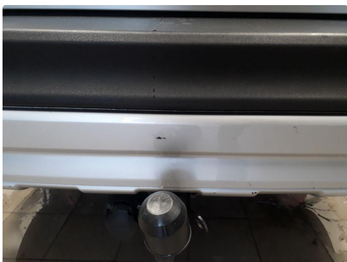
1.5 Ripe(r) ned til grunning