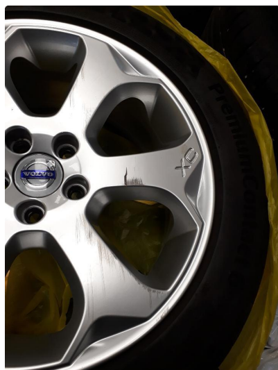
1.2 Kantkjørt felg