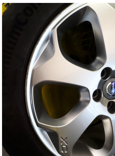
1.2 Kantkjørt felg