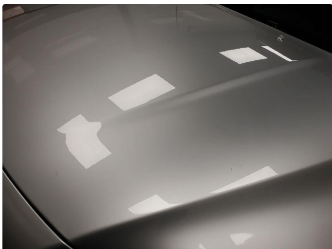
1.1 Ripe(r) ned til grunning