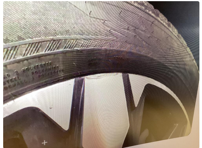
2.2 Kantkjørt felg