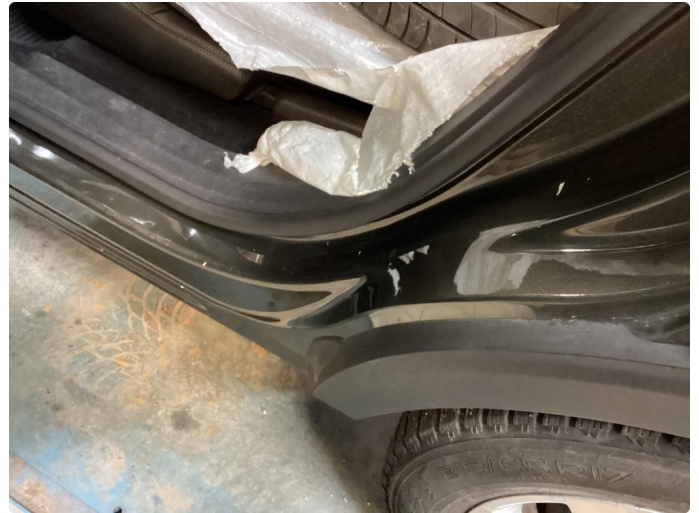
1.2 Flere bulker