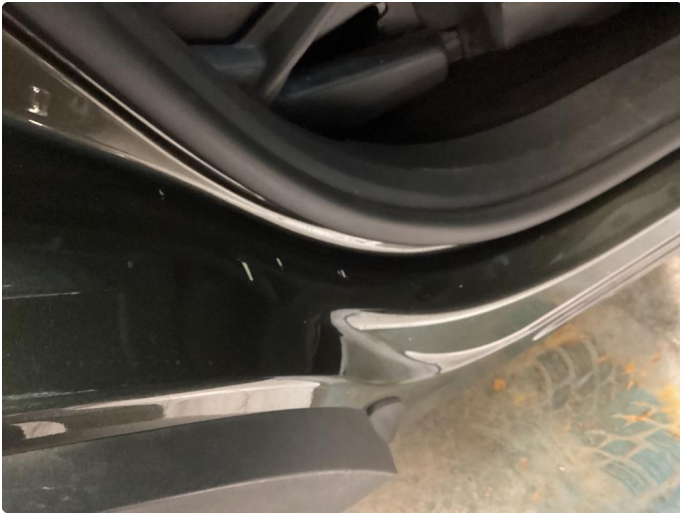
1.1 Flere bulker