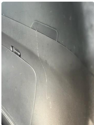
2.1 Rippe i plastik høyre side bagasjerom- Ingenutbedring trengs