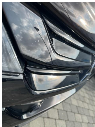
1.1 Småsteinsprut i plast grill front.- Ingen utbedring trengs