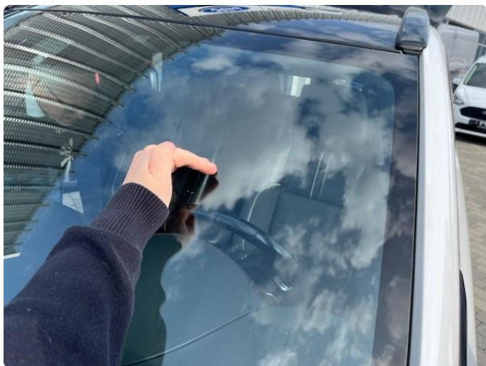
1.4 Steinsprut- ingen utbedring trengs