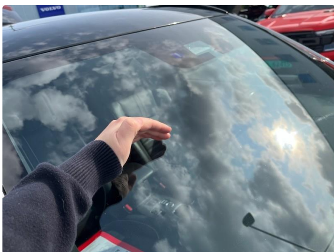
1.3 Steinsprut- Ingen utbedring trengs