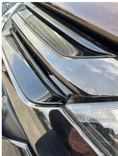
1.1 Småsteinsprut i plast grill front.- Ingen utbedring trengs