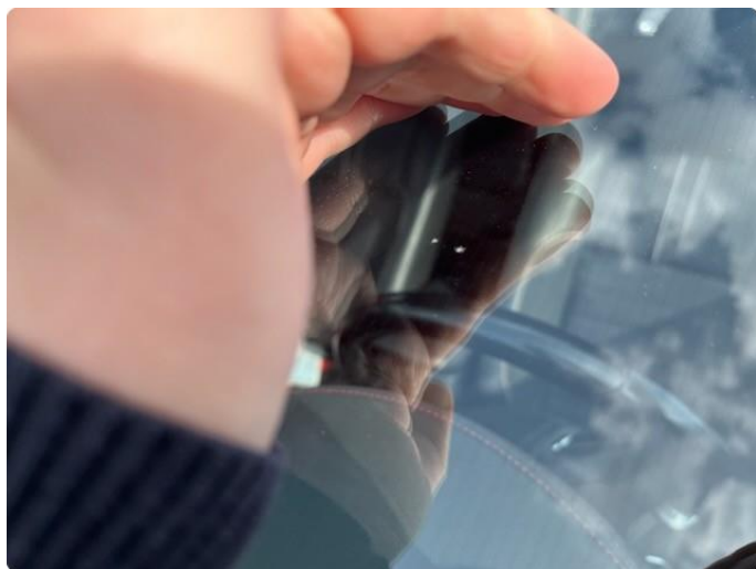
1.4 Steinsprut- ingen utbedring trengs