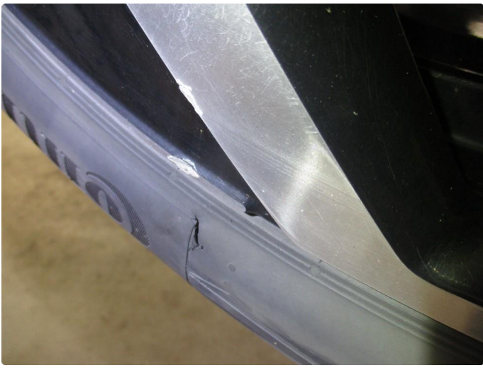
1.3 Skade på felg