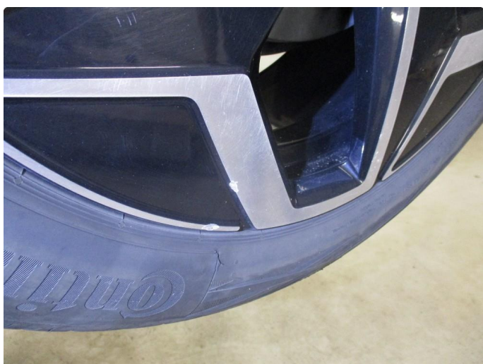
1.3 Skade på felg