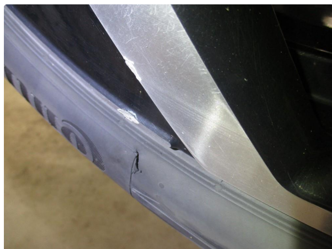
1.2 Dekkskade sommerhjul, godkjent