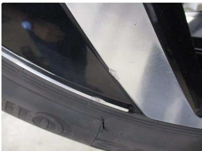
1.2 Dekkskade sommerhjul, godkjent