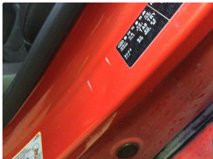
1.2 Noen riper og småbulker