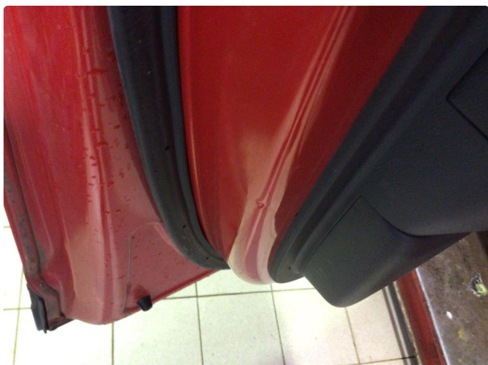
1.2 Noen riper og småbulker