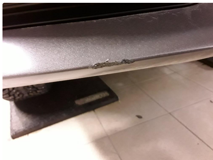
1.4 Små hakk