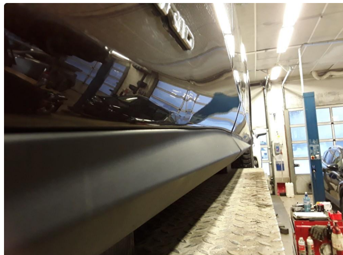
1.2 Penslet skade + bulk nederst på døra