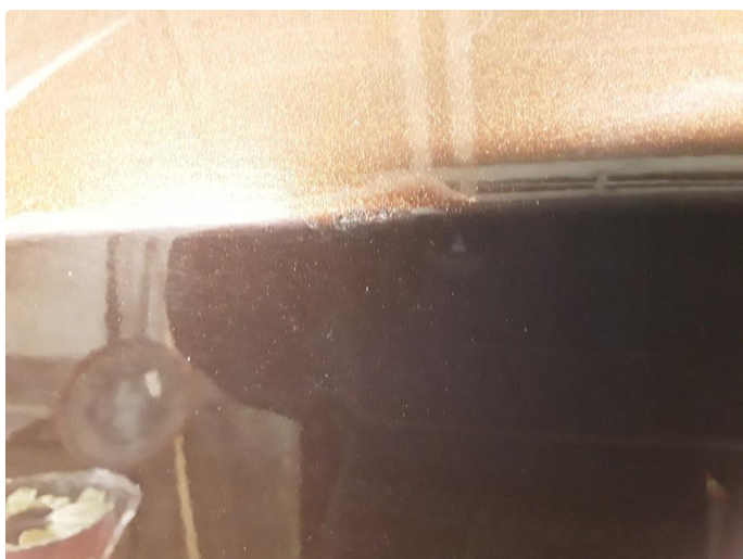
1.3 Liten ripe penslet