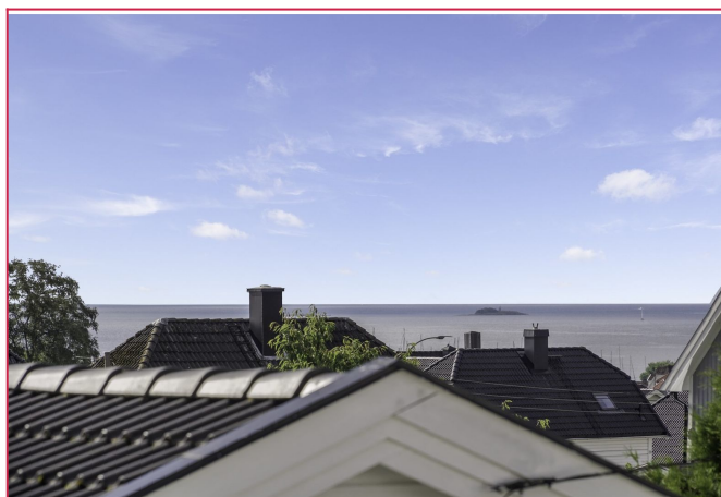
Sjøutsikt fra balkongen!