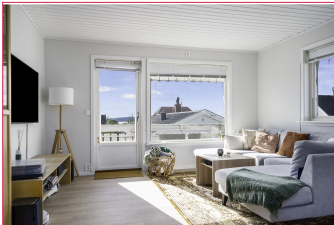
Lys og fin stue med åpen stue- og kjøkkenløsning