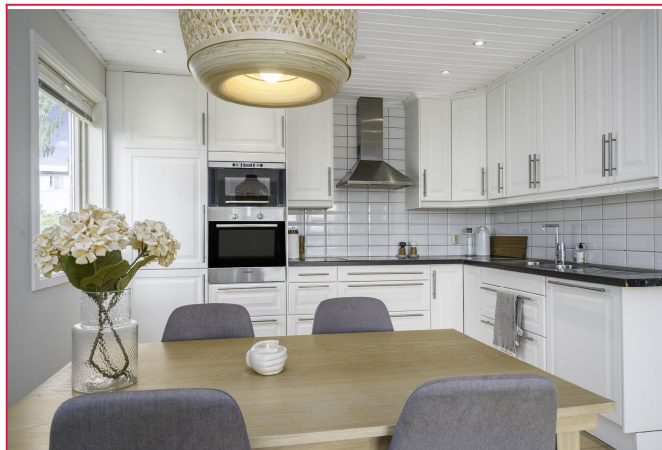
Stort kjøkken med mye skap og benkeplass. Integreerte hvitevarer