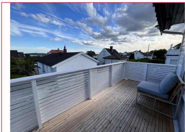
Helt ny balkong med flott sjøutsikt!