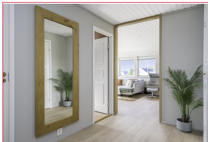
Gang med gulvvarme. plass til yttertøy og sko