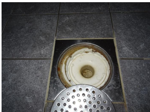
Sluk i dusjområde