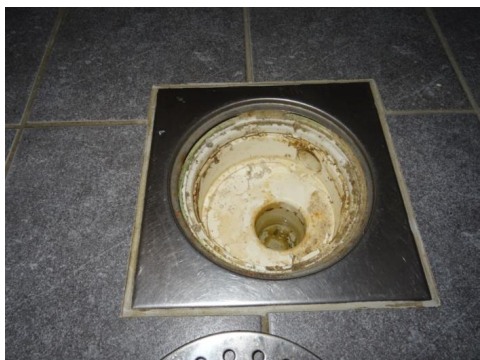
Sluk ved innredning