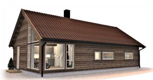
TVERRLI VEST 8