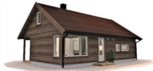
TVERRLI VEST 7