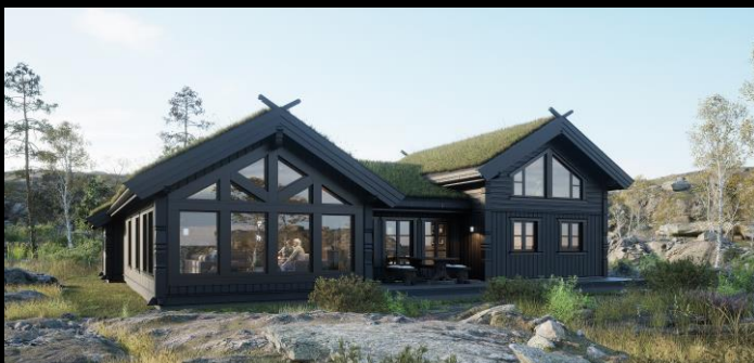
Skeikampen med garasje