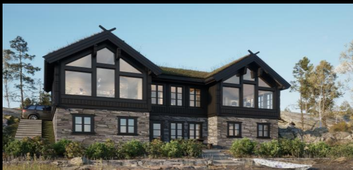
Skeikampen med kjeller