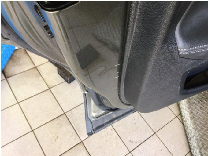
1.1 Noen riper og småbulker