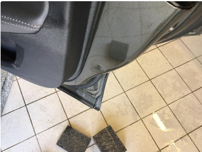
1.1 Noen riper og småbulker