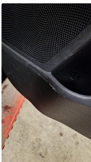
2.1 Normal bruksslitasje