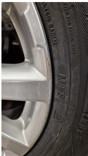
1.2 Normal bruksslitasje i felg(er)