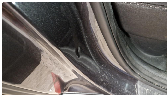
1.3 Normal bruksslitasje i døråpning(er)