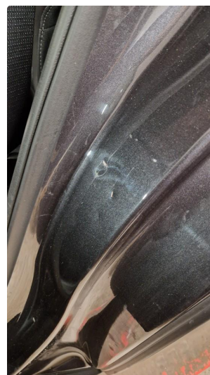
1.3 Normal bruksslitasje i døråpning(er)