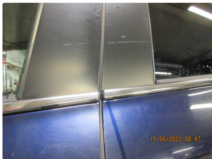
1.1 Litt steinsprang