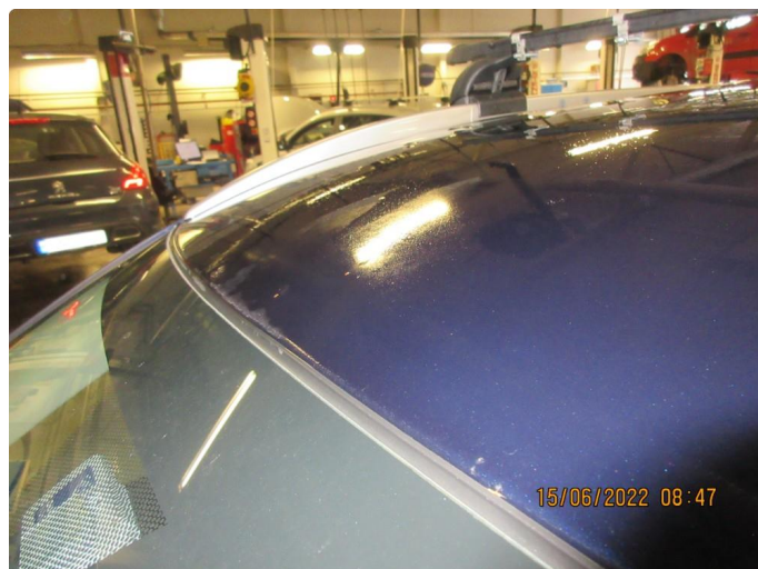
1.1 Litt steinsprang