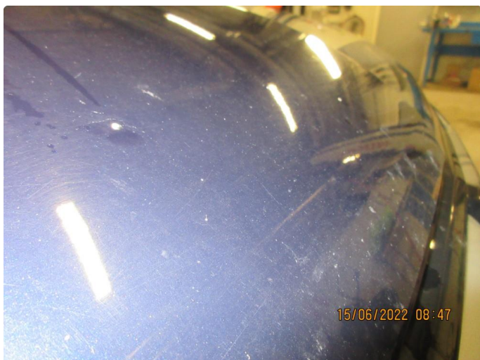
1.1 Litt steinsprang