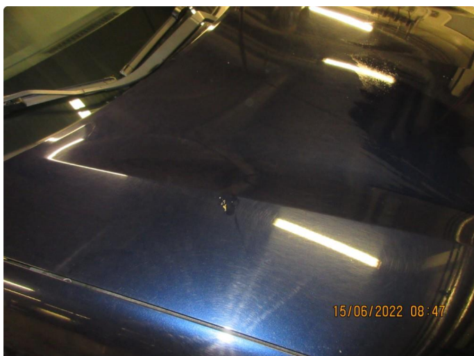
1.1 Litt steinsprang