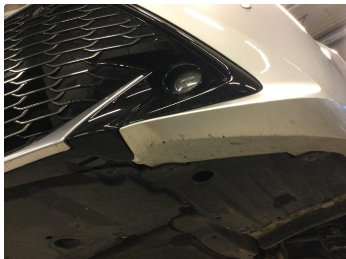
1.1 Skrubbskader underkant