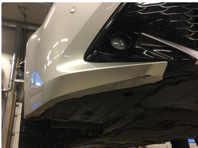
1.1 Skrubbskader underkant