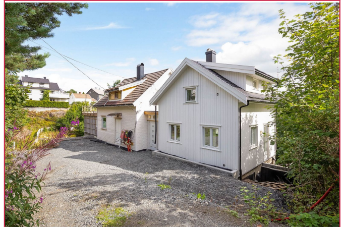
Romslig gårdsplass. Leiligheten ligger i nybygg til høyre i bildet.