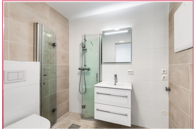
Stort, lekkert bad med opplegg til vaskemaskin.