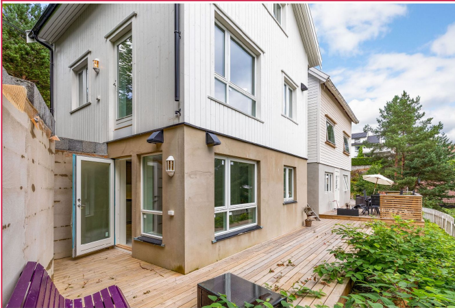
Koselig, stille og usjenert uteplass