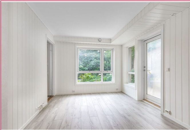
God størrelse på stue med store vinduer og god romfølelse. Utgang til egen terrasse.