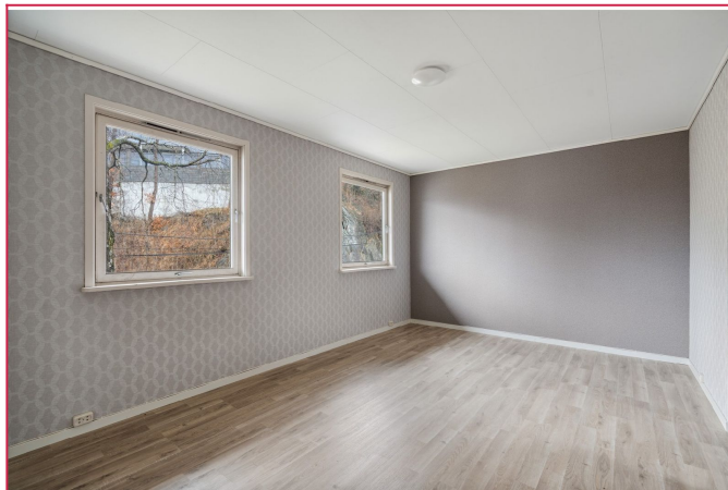
En romslig stue med plass til alkove i bakkant. Godt med lys og hybelen har en effektiv planløsning.