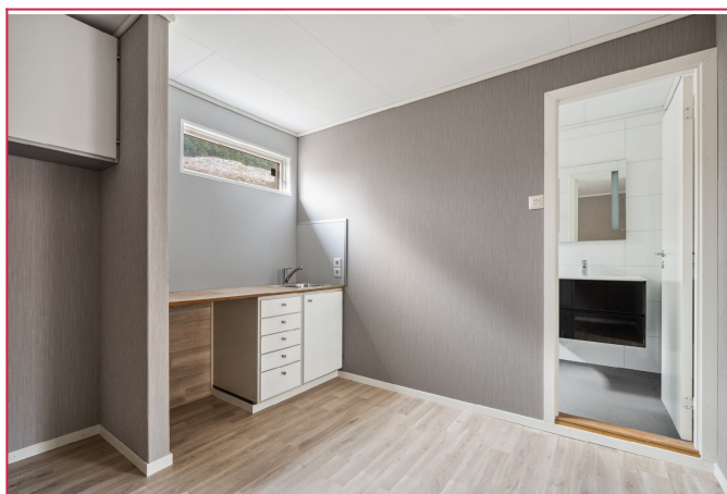
Kjøkkeninnredningen er liten og praktisk.