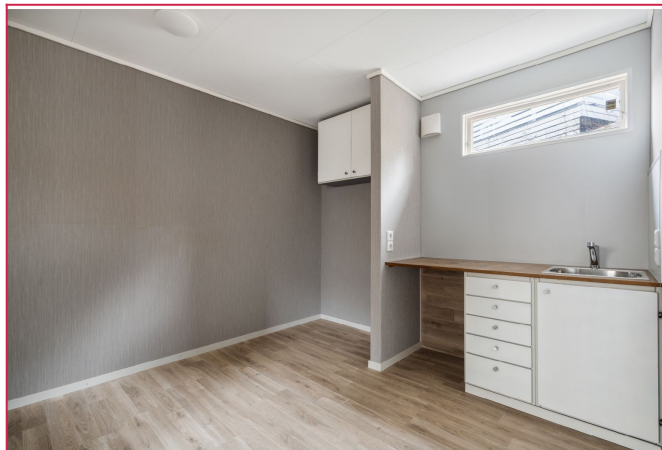
God plass til spisestue på kjøkkenet.