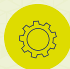
UTVIKLING OG TILRETTELEGGING