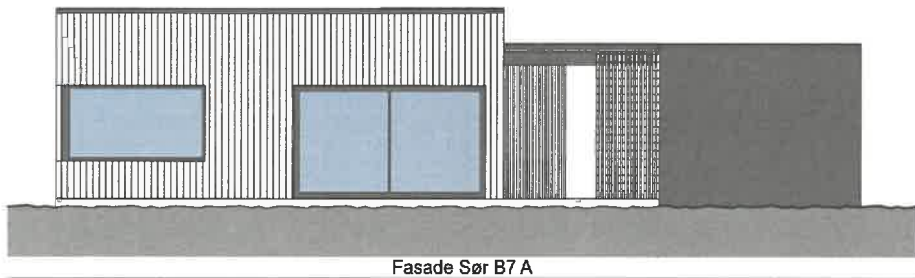
Fasade Sør B7 A