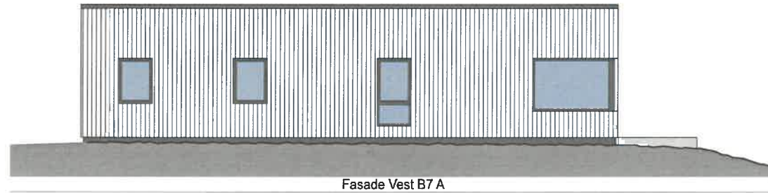
Fasade Vest B7 A