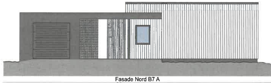
Fasade Nord B7 A