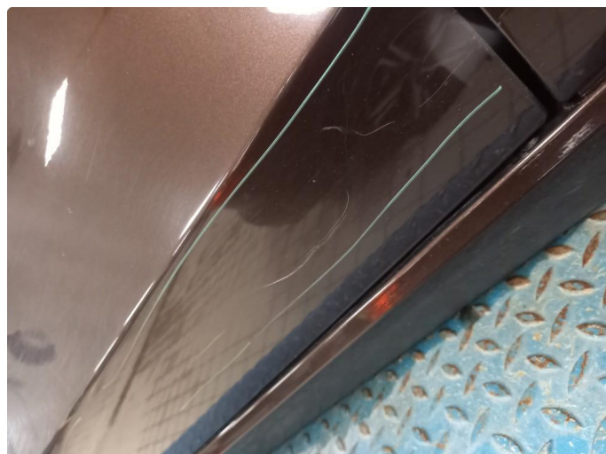
1.3 Høyre fordør lakkeres grunnet riper