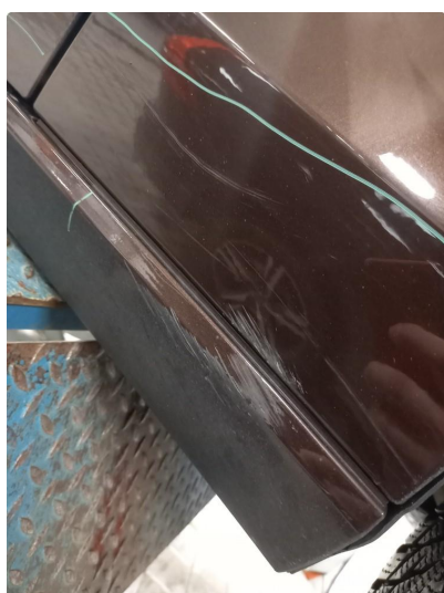
1.6 Høyre sideskjørt lakkeres grunnet riper