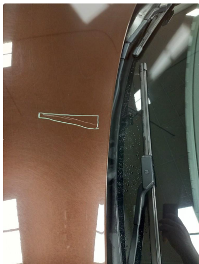
1.2 Panser lakkeres grunnet ripe