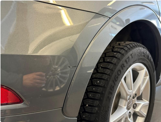
1.1 Ripe ned til grunning i fanger/plast