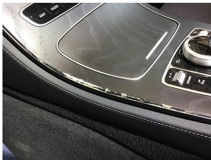
2.1 Missfarget / slitasje i kanter på midtkonsoll