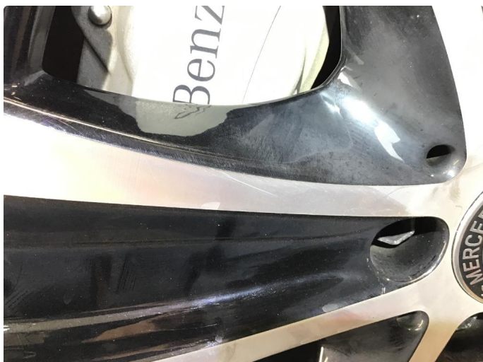
1.2 Normal bruksslitasje på felger