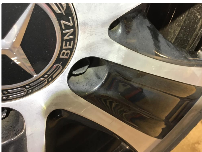
1.2 Normal bruksslitasje på felger