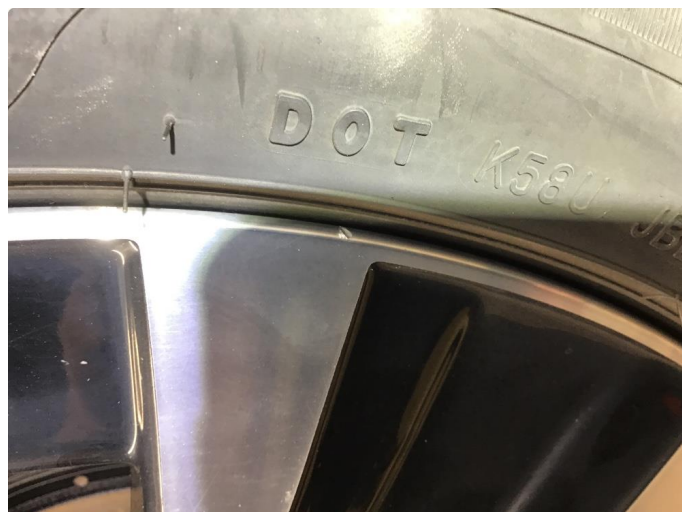
1.2 Normal bruksslitasje på felger