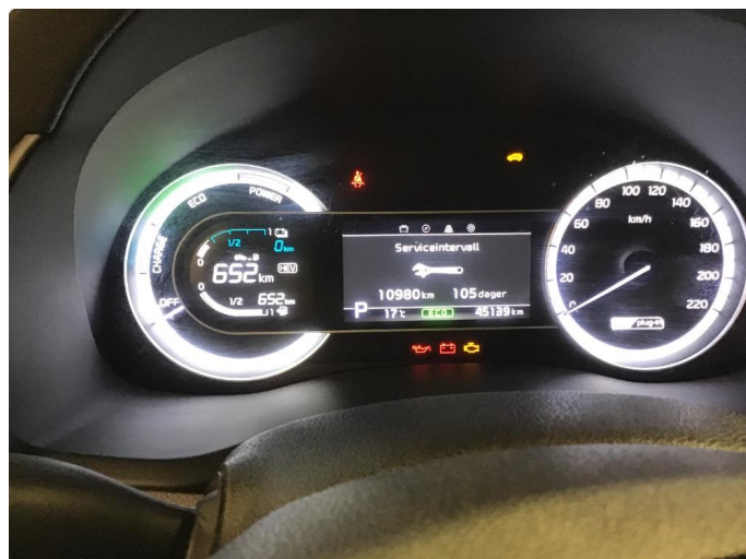
2.1 Komplette servicehistorikk. Siste services utføres før levering.