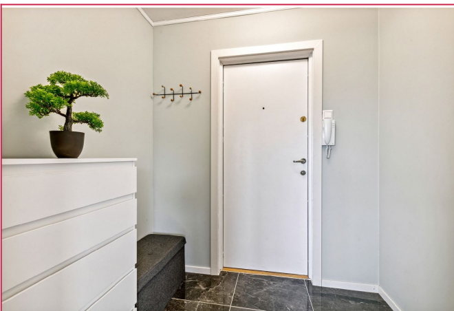
Entr  med god plass til   henge fra seg jakker og yttersko