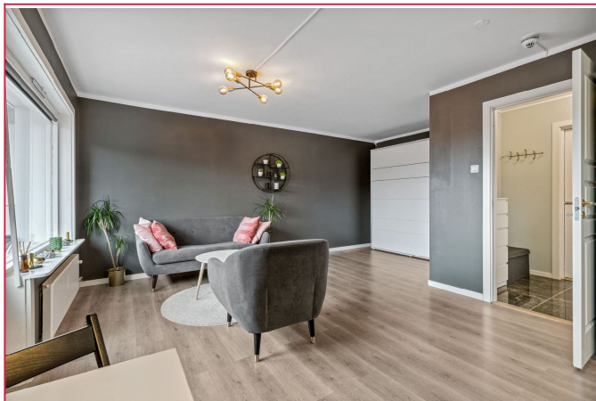
Leiligheten holder god standard med delikate farge- og materialvalg

SAKSNUMMER 36337 - BERGENSVEIEN 4A, 0963 OSLO