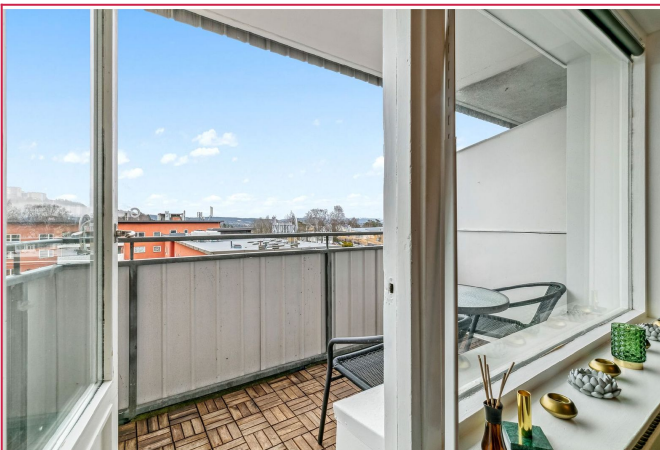
Fra balkongen er det utsikt mot n romr det og gode solforhold