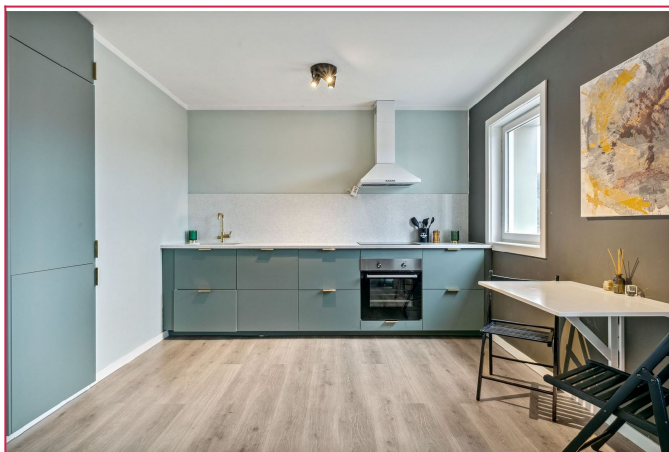
Pent k kken med integrerte hvitevarer og godt med benkeplass