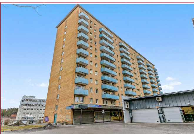
Leiligheten ligger i 5. etasje og i umiddelbar n rhet til flere butikker og off. komm.