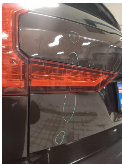
1.4 Bakluke rettes grunnet liten skade