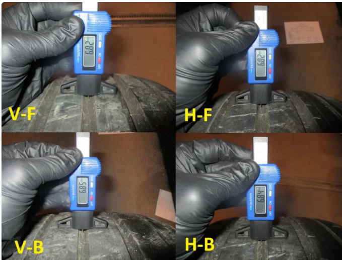
1.1 Mønsterdybde målt på sommerdekk 09.03.2023 ved 2946km