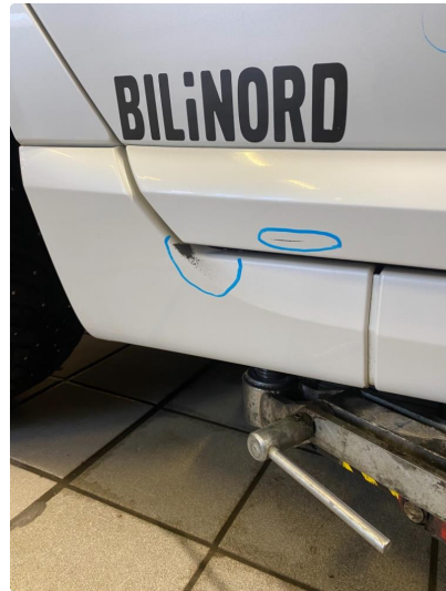
1.2 Bruks merkes