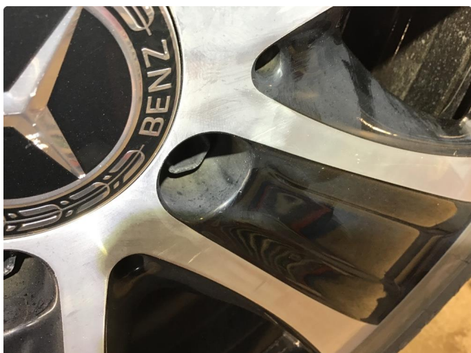
1.2 Normal bruksslitasje på felger