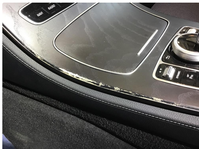
2.1 Missfarget / slitasje i kanter på midtkonsoll