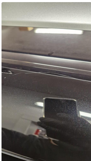
1.1 Normal bruksslitasje