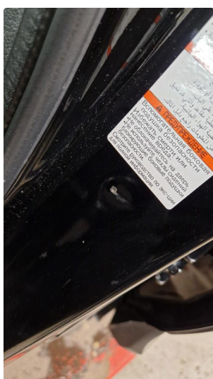
1.2 Mindre bulk etter beltespenn