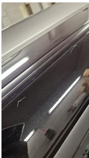
1.1 Normal bruksslitasje