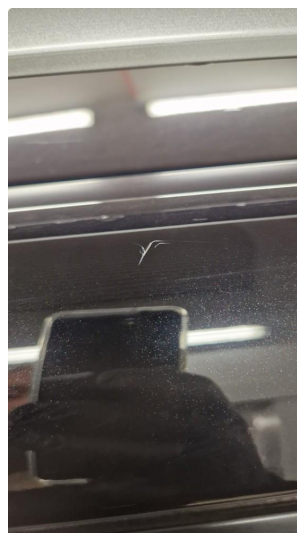
1.1 Normal bruksslitasje