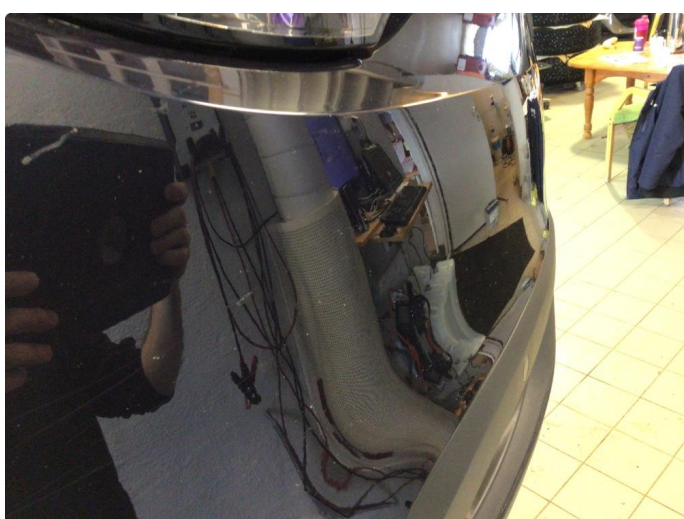
1.2 Noe steinsprut