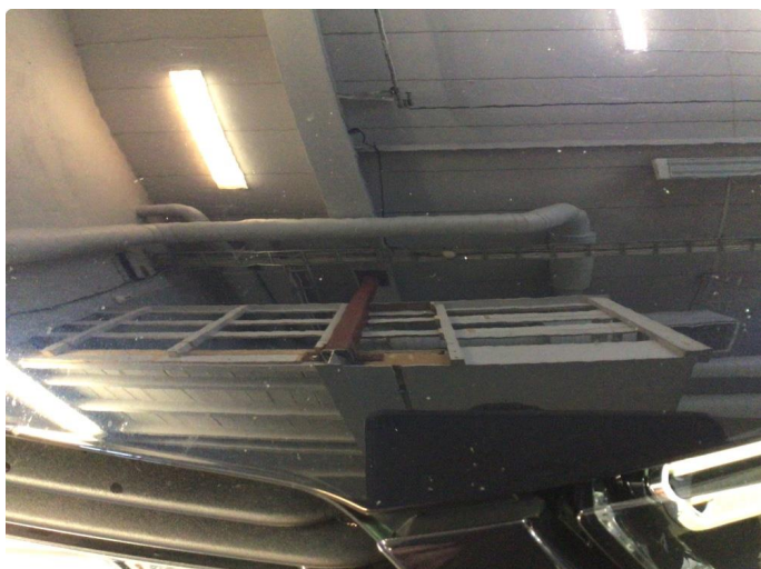
1.1 Noe steinsprut