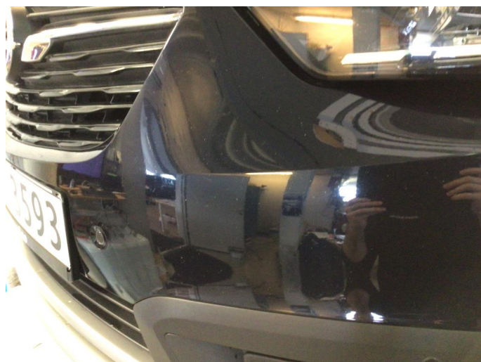
1.2 Noe steinsprut