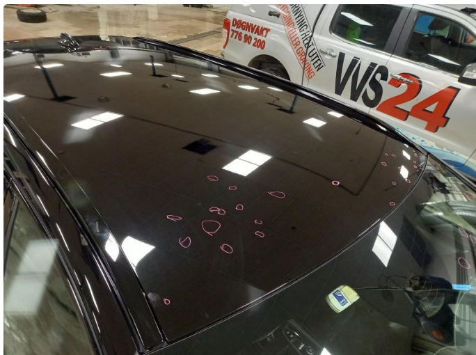
1.1 Lakkrens og polering utført