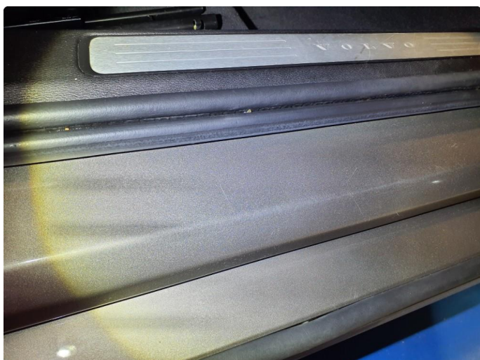
1.2 Svak ripper - Normal slitasje