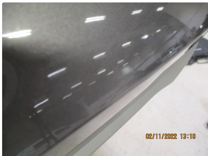
1.1 Noen sprekker i lakk fanger bak