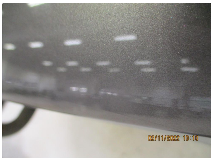
1.1 Noen sprekker i lakk fanger bak