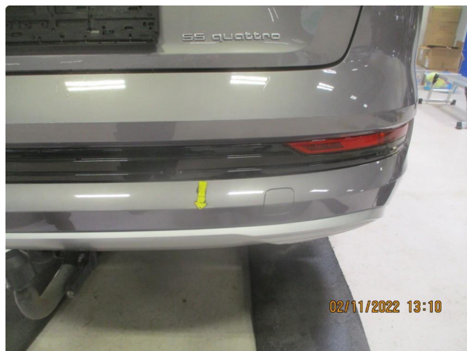
1.1 Noen sprekker i lakk fanger bak