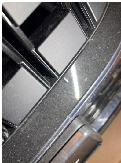
1.4 Øvrige feil