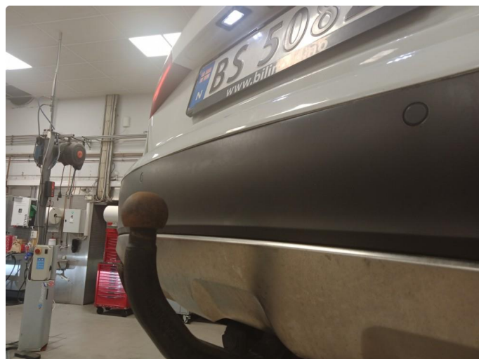
1.1 Støtfanger bak rettes før levering