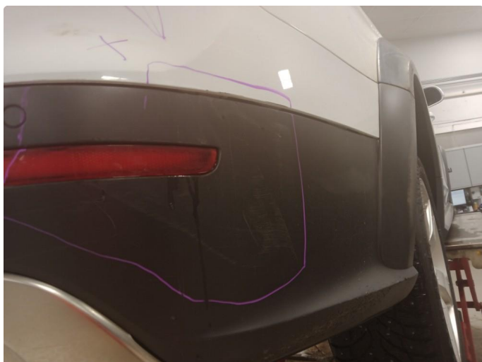
1.1 Støtfanger bak rettes før levering