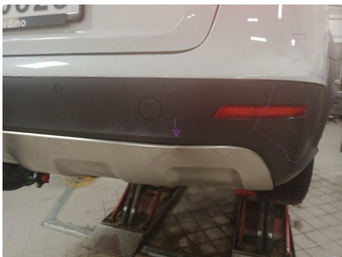
1.1 Støtfanger bak rettes før levering