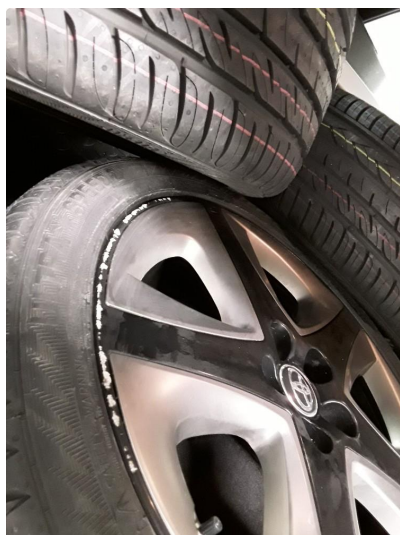
1.10 Riper felg