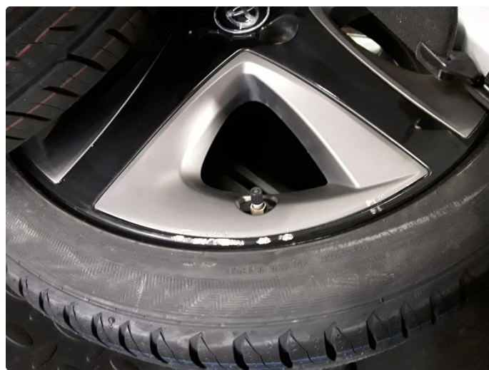
1.10 Riper felg