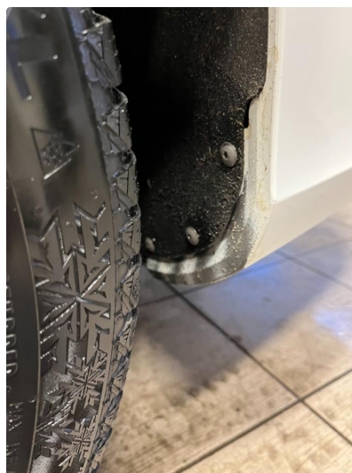
1.2 Ripe(r) ned til grunning