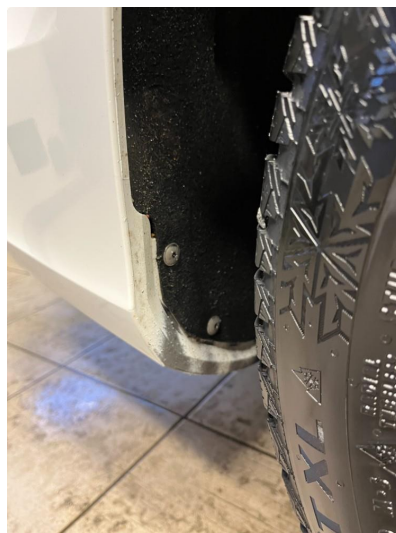
1.2 Ripe(r) ned til grunning