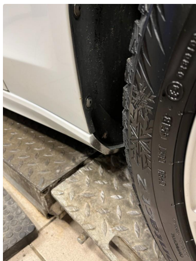
1.2 Ripe(r) ned til grunning