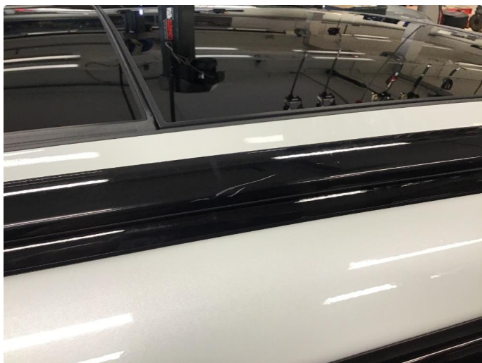
1.4 Lister skadet/mangler