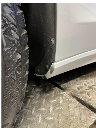
1.2 Ripe(r) ned til grunning