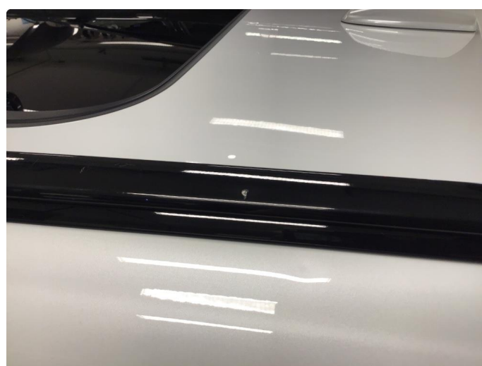
1.3 Lister skadet/mangler