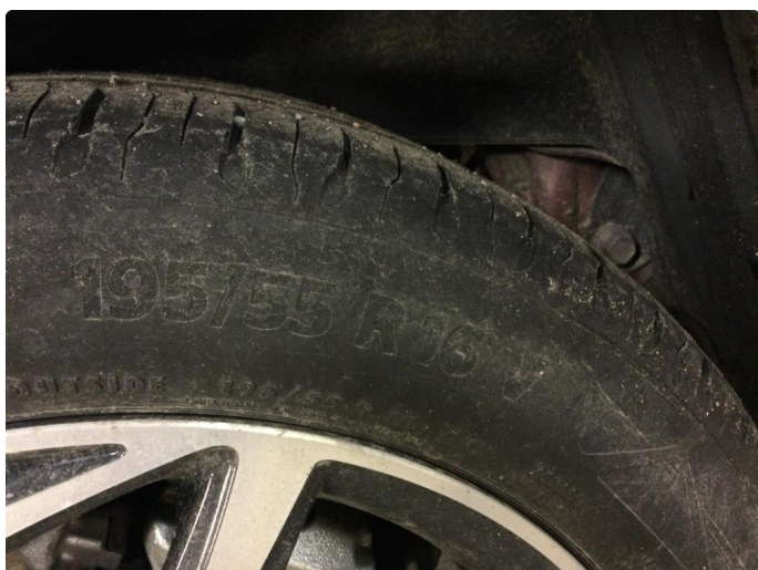
1.3 For liten mønsterdybde sommerdekk