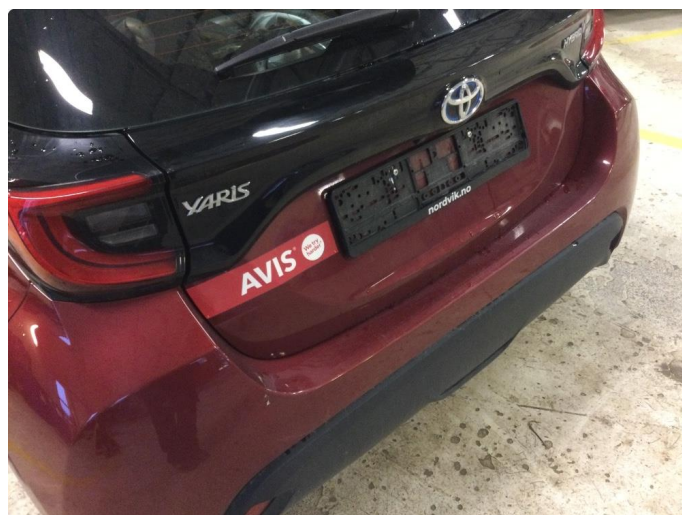
2.1 Reklame fjernet.