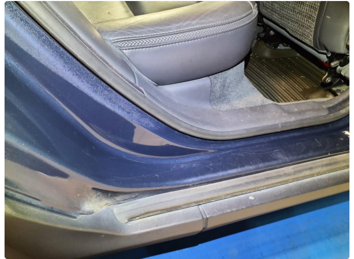
1.2 Ripe(r) - Dempes før salg