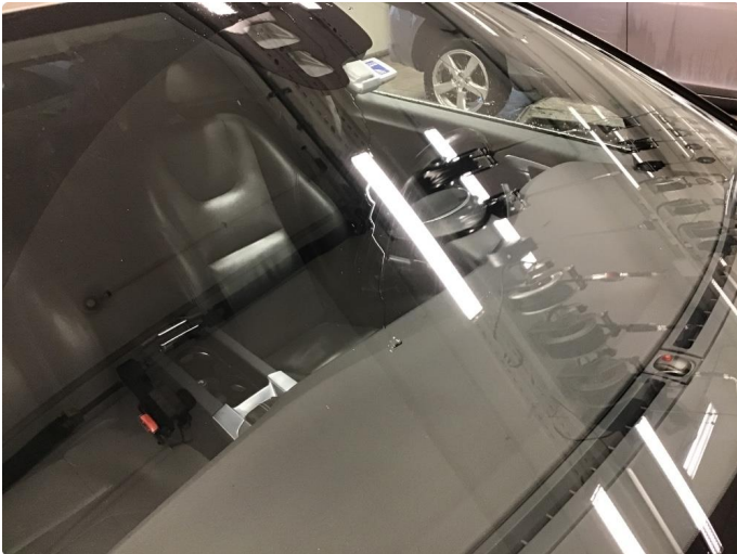
1.1 Normale bruksmerker etter visker front og bakrute