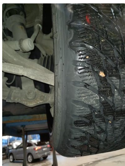
1.3 Nye vinterdekk