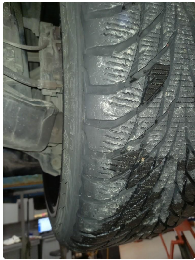
1.3 Nye vinterdekk