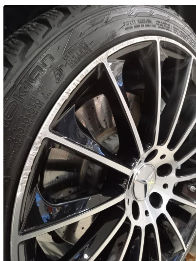
1.2 Vinterfelger lakkeres i sort