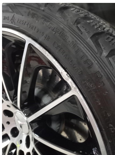
1.2 Vinterfelger lakkeres i sort