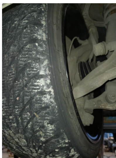
1.3 Nye vinterdekk