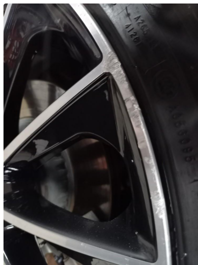
1.2 Vinterfelger lakkeres i sort