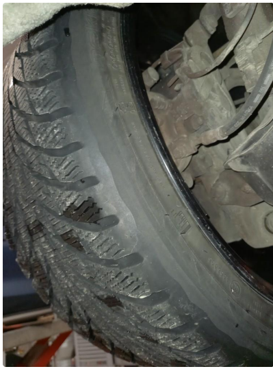
1.3 Nye vinterdekk