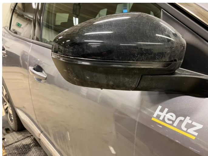
2.1 Krakelering i plast Kommantar: Blir utbedret 09.01.24