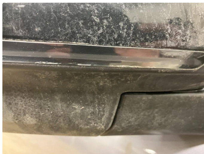
2.1 Krakelering i plast Kommantar: Blir utbedret 09.01.24