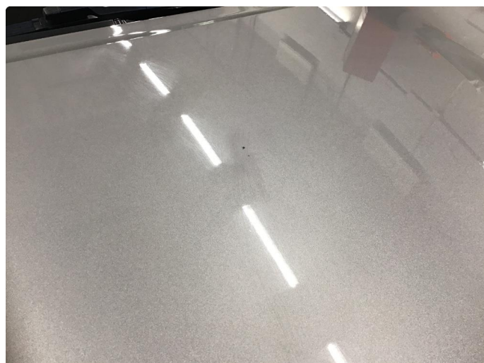
1.1 Steinsprang og riper finnes