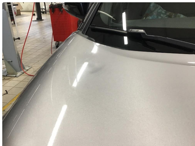
1.1 Steinsprang og riper finnes