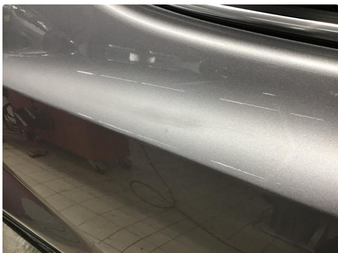
1.1 Steinsprang og riper finnes