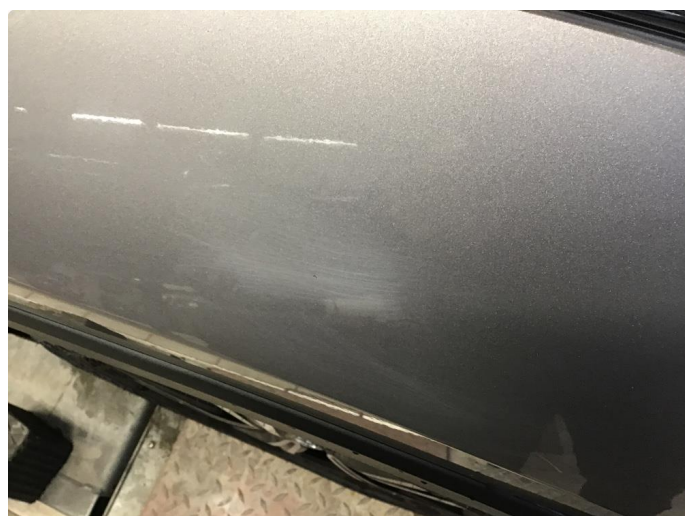
1.1 Steinsprang og riper finnes