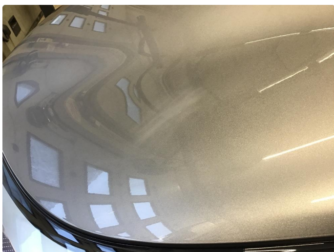
1.1 Steinsprang og riper finnes