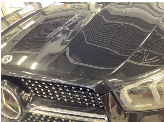
2.1 Mye stensprut