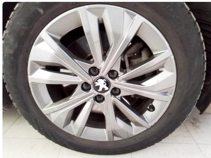
1.5 Kantkjørt felg