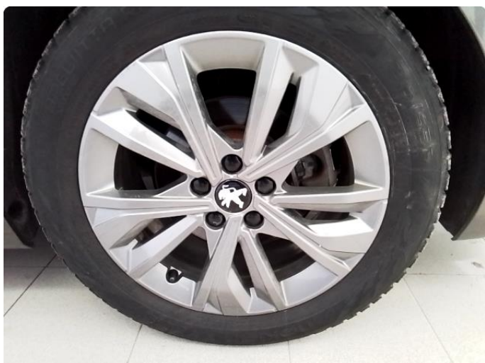
1.5 Kantkjørt felg