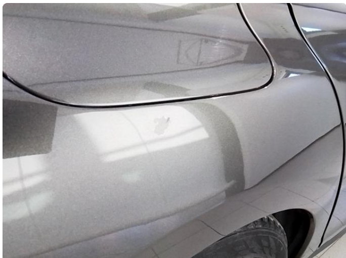
1.4 Liten bulk ved drivstofflokk