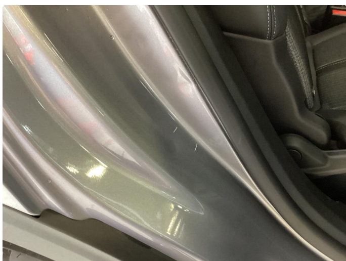
1.3 Bulk(er) med lakkskade