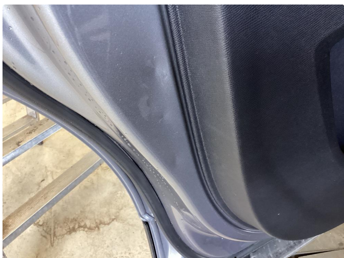
1.2 Bulk(er) med lakkskade