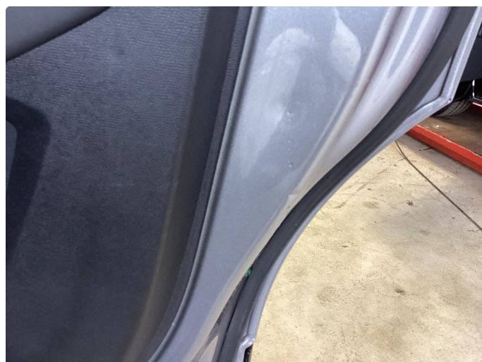
1.3 Bulk(er) med lakkskade