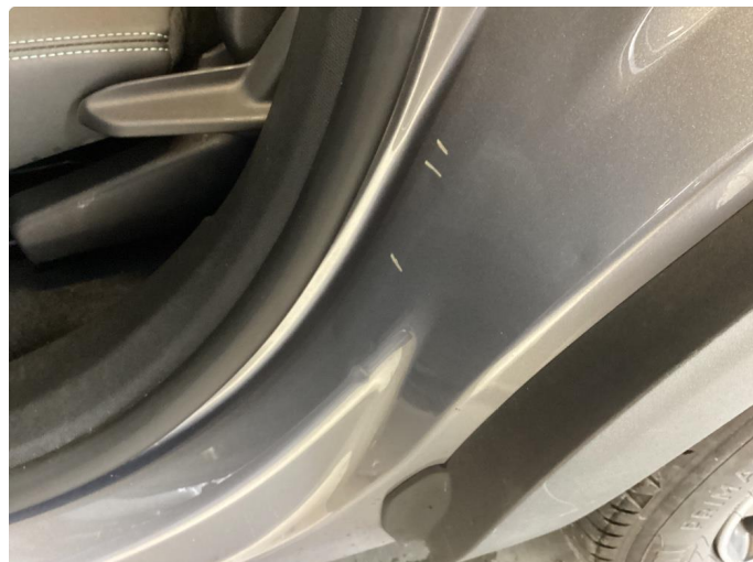
1.2 Bulk(er) med lakkskade