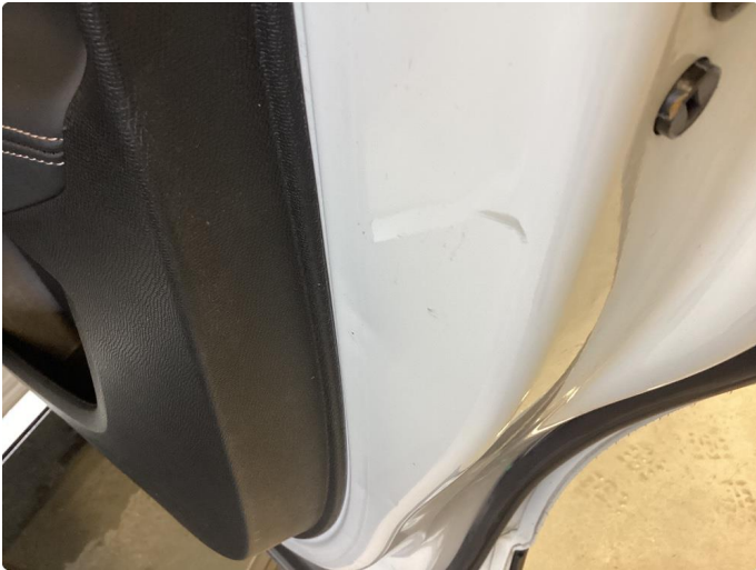
1.2 Bulk(er) med lakkskade