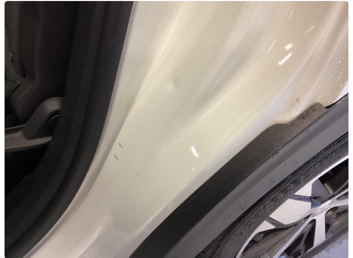
1.2 Bulk(er) med lakkskade